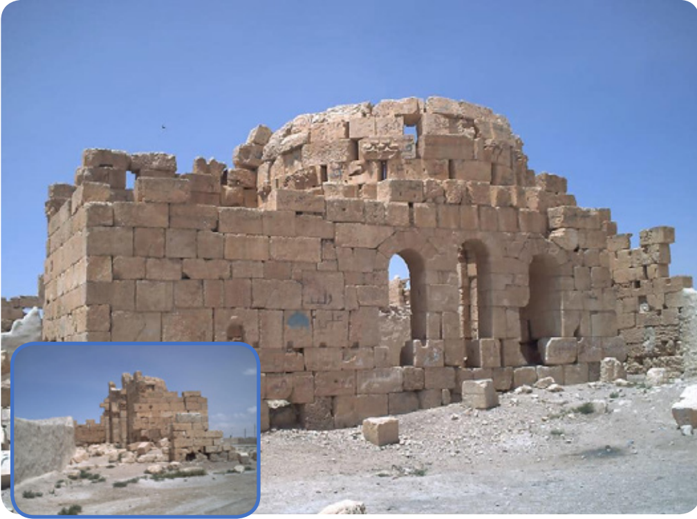
تقع قرية حوارين على تخوم البادية السورية على بعد 80 كم إلى الجنوب الشرقي من حمص، فيها العديد من المباني الأثرية تعود للعهد الروماني.