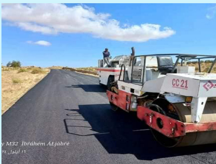
by M32 Ibrāhēm ALjābrē ١٦ أيلول ٢٤

الورود على طريق المسار البديل ( حمص- تدمر ) وطريق حمص - طرطوس ( ذهاباً وإياباً ) وطريق حمص دمشق ( ذهاباً وإياباً ) وطريق حمص السلمية-المشرفة المخرم العثمانية الفرقلس في مواقع متفرقة